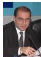
Тосунян Гарегин Ашотович, Президент Ассоциации российских банков