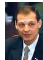
Хайруллин Айрат Назипович, Президент Национального союза производителей молока